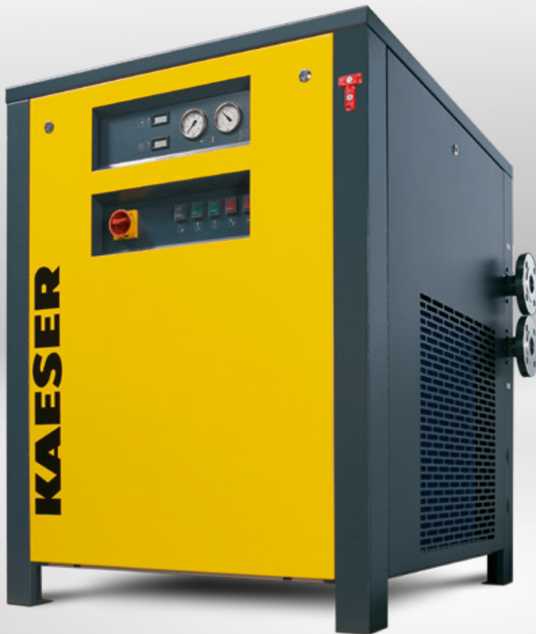
THP 40-50 Version standard