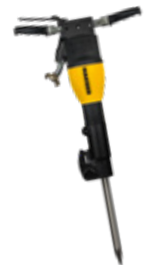
Abb.: AH 180 V