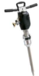
Abb.: BH 16 V