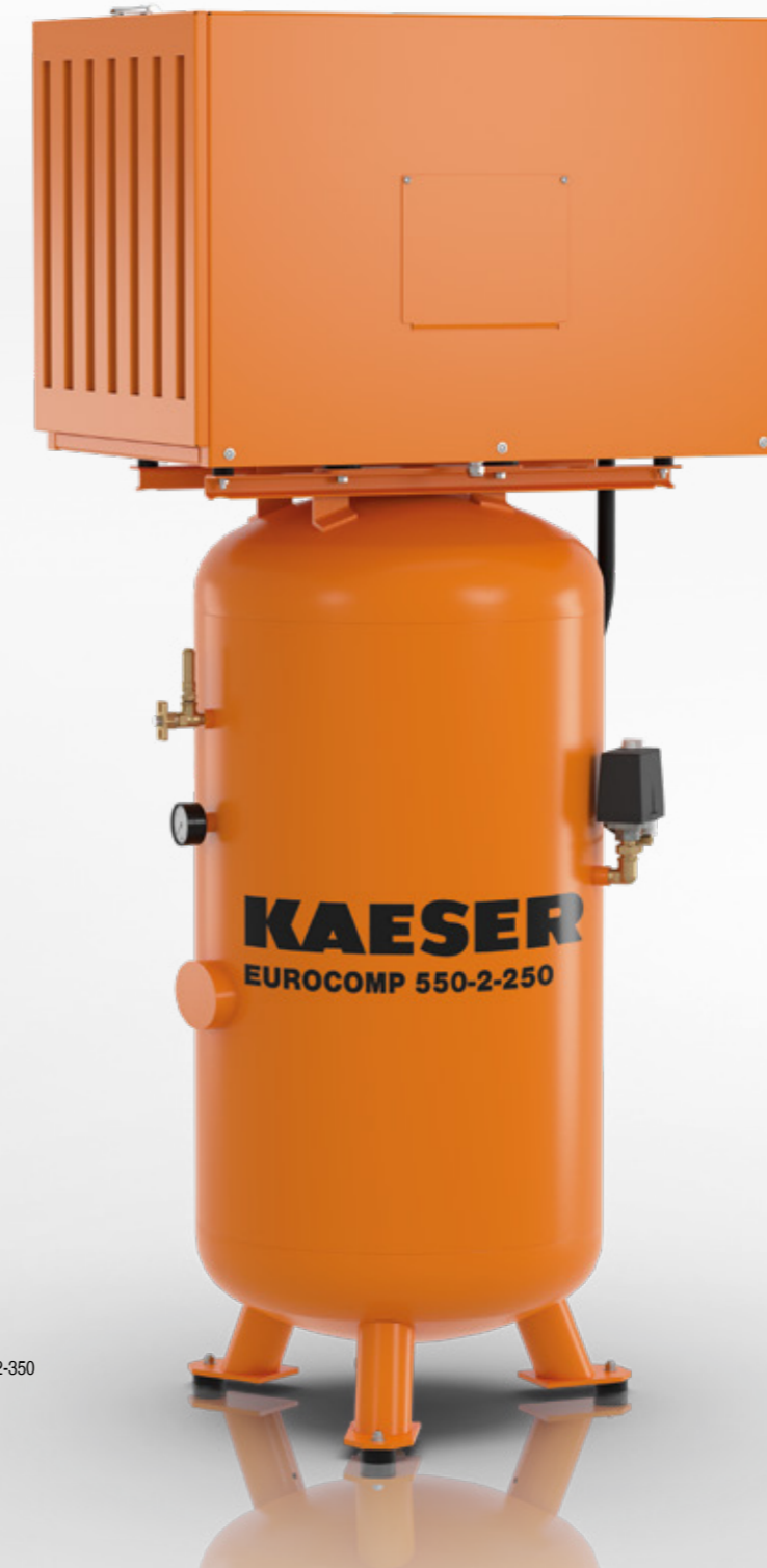
Abb.: EPC 550-2-350

Hohe Qualität für eine lange Lebensdauer