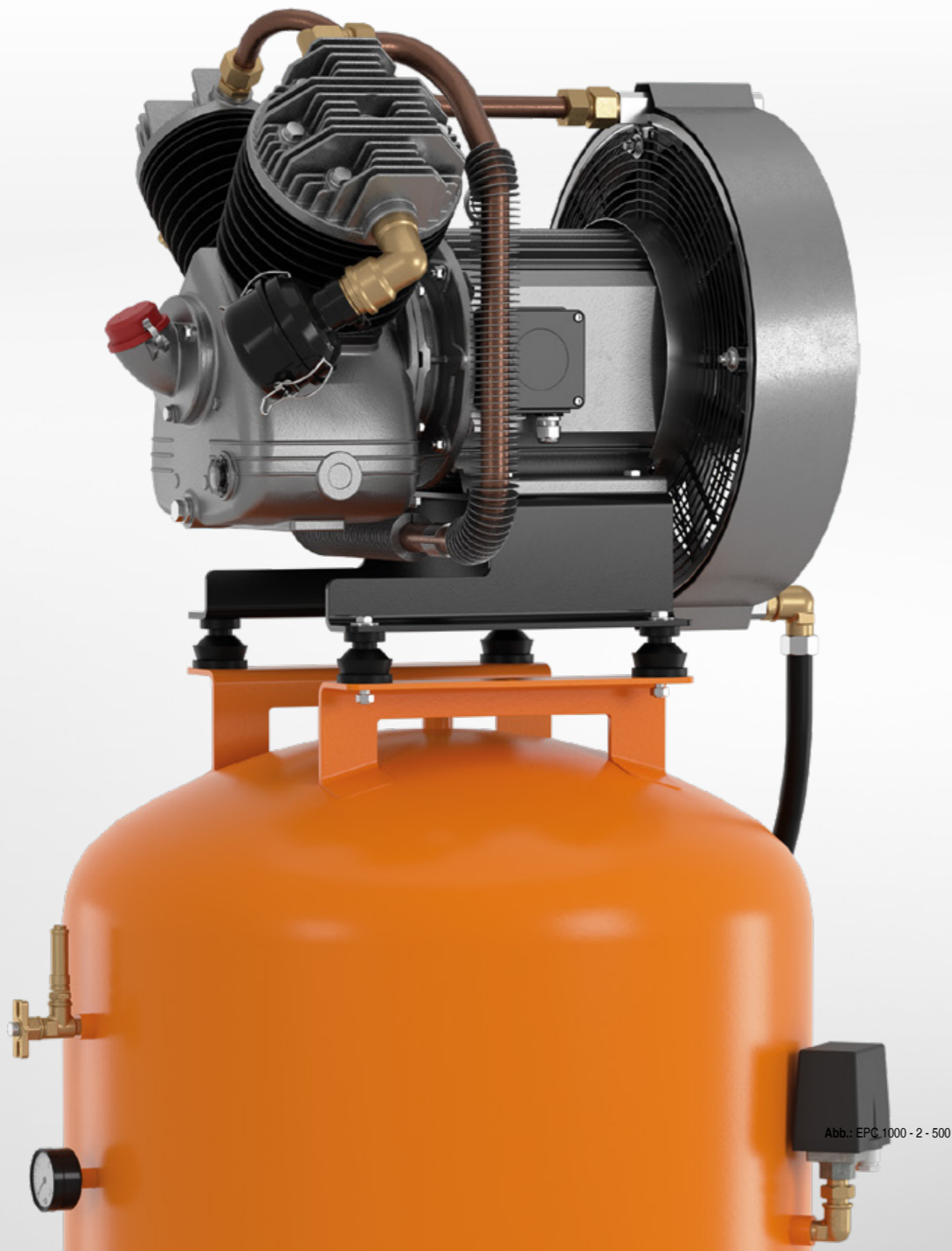
Abb.: EPC 1000 - 2 - 500