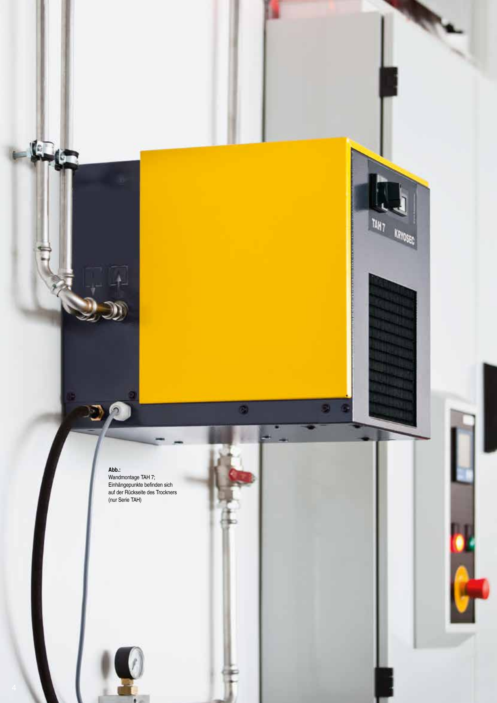
Abb.: Wandmontage TAH 7; Einhängepunkte befinden sich auf der Rückseite des Trockners (nur Serie TAH)