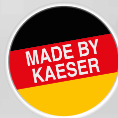
Abb.: TAH 7