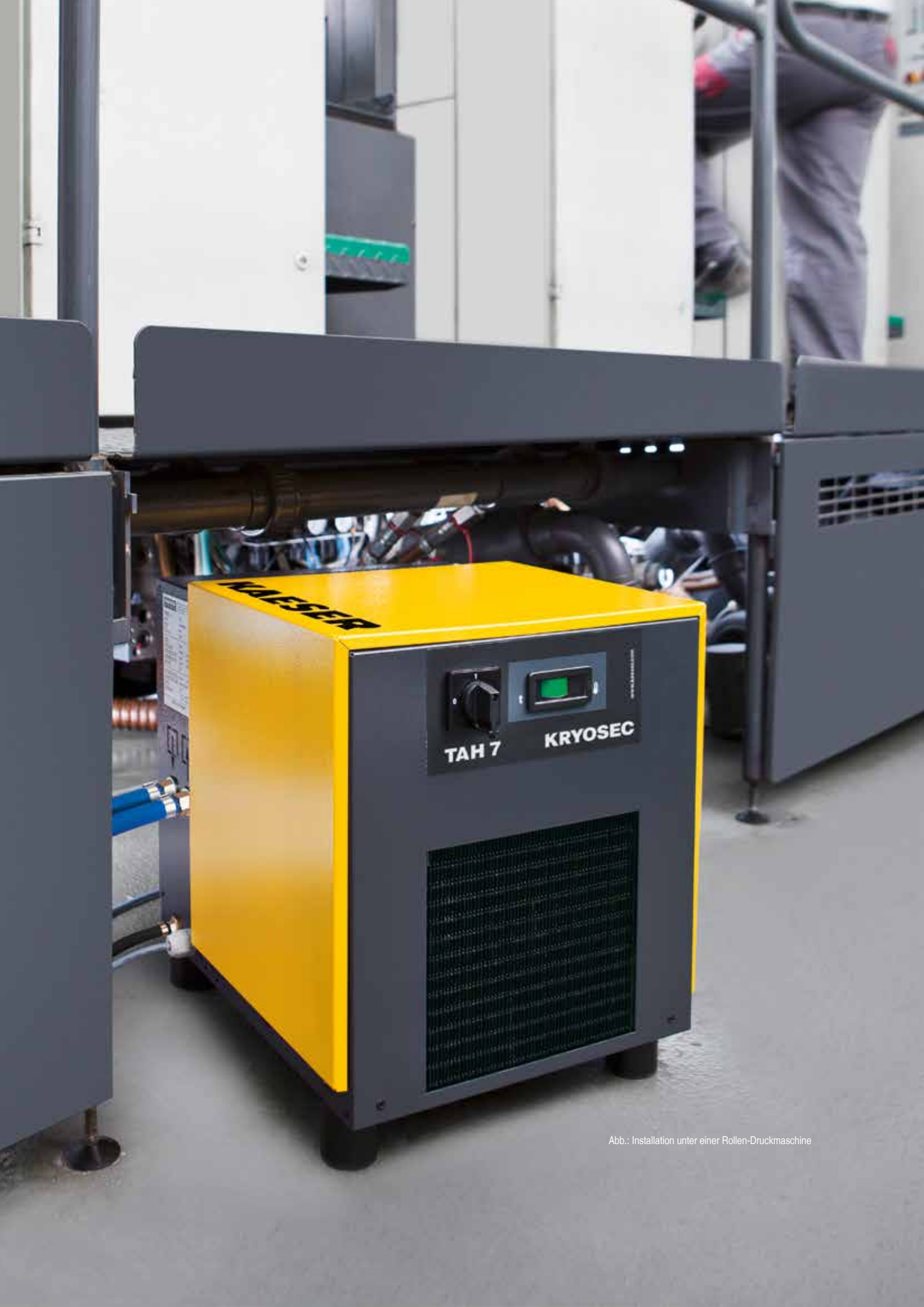
Abb.: Installation unter einer Rollen-Druckmaschine