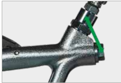
Double raccord sur la poignée