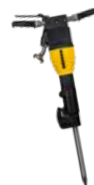
Fig. : AH 180 V