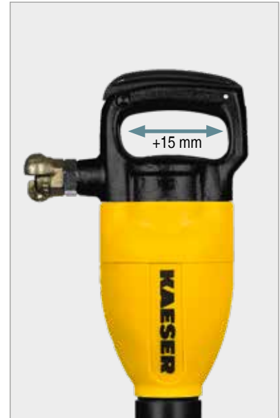
Passage de main agrandi