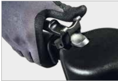
Protection ergonomique du bouton