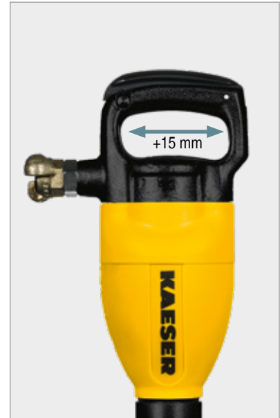
Passage de main agrandi