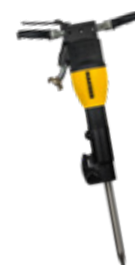
Fig. : AH 180 V