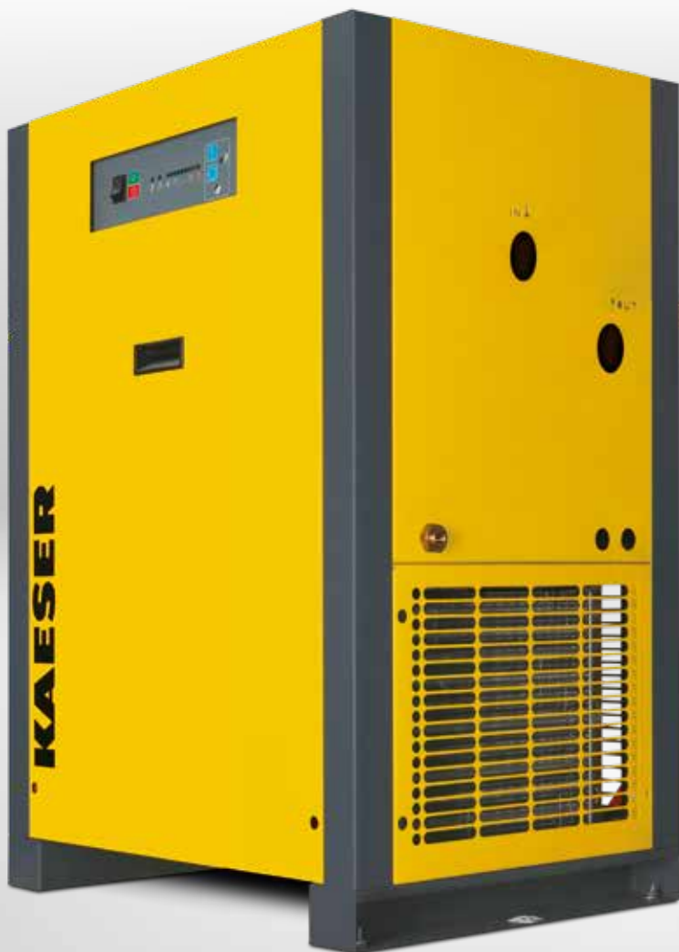
THP 40-50 Version standard